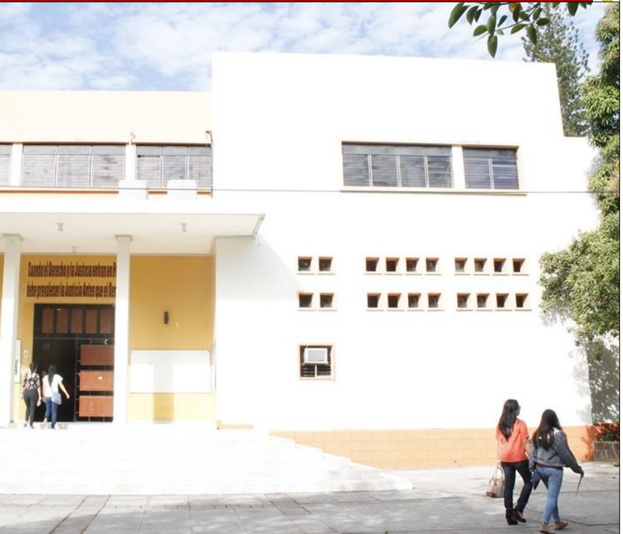
de Jurisprudencia y Ciencias Sociales de la Universidad de El Salvador